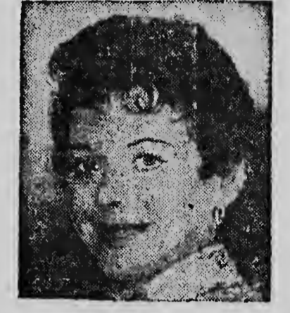
Hedy naar Parijs. - Voor haar reis naar Parijs heeft Hedy Lamar het nieuwste in Italië bijzonder populaire kapsel gekozen. Hedy Lamar, de gevierde Hollywoodse, gaat momenteel, als velen haer collegae, een film maken in Italië.

Wij menen er goed aan te doen om erop te wijzen, dat bij sport geen politiek thuis hoort. Hoeveel